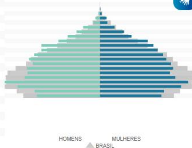
FIGURA 02 – Praia Grande (IBGE 2010): IDH = 0,718

100 ou mais 95 a 99 90 a 94 85 a 89 80 a 84 75 a 79 70 a 74 65 a 69 60 a 64 55 a 59 50 a 54 45 a 49 40 a 44 35 a 39 30 a 34 25 a 29 20 a 24 15 a 19 10 a 14 5 a 9 0 a 4