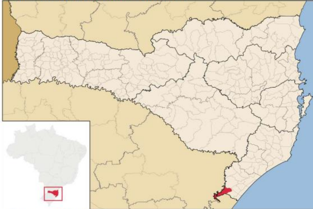
Figura 1 – Localização do município em Santa Catarina